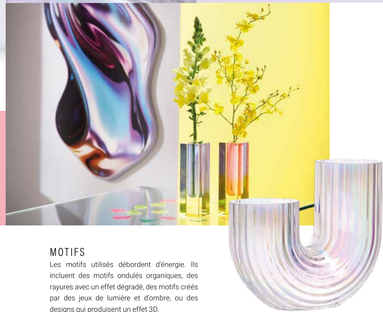
Effet irisé sur le verre.

COULEURS Les couleurs employées sont variées et affirmées, oscillant entre teintes vives et nuances pastel. Cette large palette haute en couleurs évoque presque un arc-en-ciel et est complétée par un gris neutre.